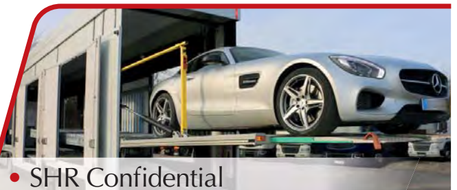
• SHR Confidential