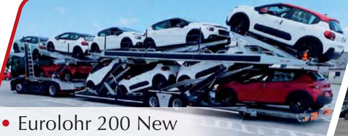
• Eurolohr 200 New