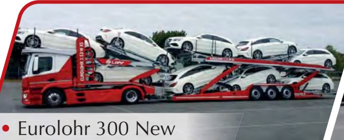
• Eurolohr 300 New