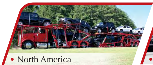
• North America